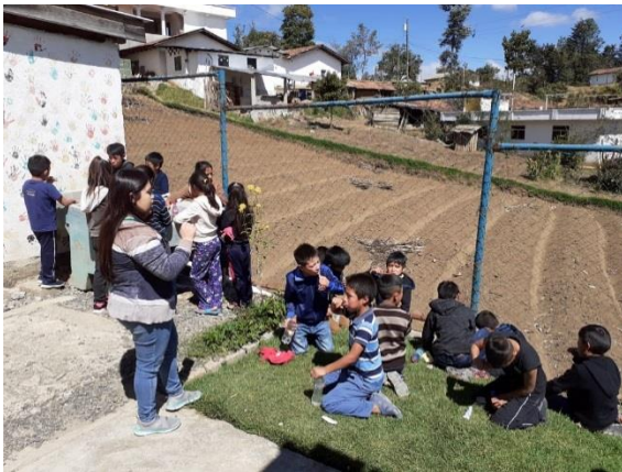
Cepillado de dientes con los niños