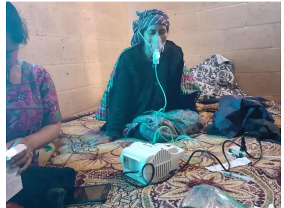
Visita en la casa en Chocruz

Los primeros meses del año recibimos a varios pacientes con diferentes problemas de salud. Cuando los pacientes están graves y no pueden asistir a la clínica, nosotras los visitamos en sus casas, para ahí darles atención médica y ayudarlos en lo que necesitan.