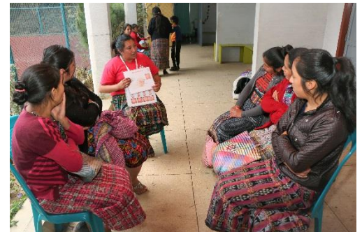
Taller sobre planificación

A finales del año 2020 coordinamos una jornada de planificación familiar con la asociación ALAS de Guatemala, con la finalidad de aplicar el método jadelle. Se realizó la inserción a dos señoras, las cuales fueron las únicas que se interesaron por el método. En nuestra comunidad es un poco complicado hablar de métodos de planificación familiar a causa de las creencias religiosas, así como del miedo que tienen las mujeres a utilizar estos métodos. Muchas mujeres usan algún método de planificación, sin embargo, en algunas ocasiones se ven obligadas a hacerlo a escondidas, pues sus esposos o suegras no están de acuerdo. En nuestra comunidad y en nuestro país es importante y urgente que las mujeres planifiquen. Actualmente hay muchos niños que sufren de desnutrición, pues las parejas son de bajos recursos económicos y tienen varios hijos.