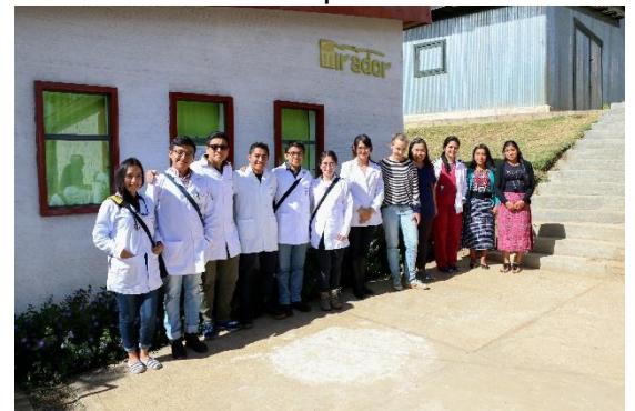
El equipo de la jornada

En el mes de marzo tuvimos una jornada médica. Durante esta, varios médicos voluntarios provenientes de Xela nos visitaron para dar apoyo a nuestra comunidad. La mayoría de las personas de nuestra comunidad son de escasos recursos económicos, razón por la cual planeamos esta jornada. En la jornada se ofrecieron diversas consultas: consulta general, consulta prenatal, consulta ginecológica, consulta pediátrica, planificación familiar, entre otras. En esta actividad se recibió a varios pacientes, los cuales se mostraron agradecidos con la atención que se les brindó, así como por el apoyo que recibieron: la consulta fue gratuita y los medicamentos fueron cobrados al mínimo, mientras que las personas que realmente no podían pagar su medicamento, recibieron este de forma gratuita. En esta jornada recibieron atención médica 30 pacientes. Además de esto, recibimos el apoyo de la asociación ALAS de Guatemala, para dar una charla sobre los métodos de planificación familiar, durante la cual las mujeres se mostraron muy interesadas por el tema. De esta forma finalizamos nuestra jornada, que tuvo un gran éxito.